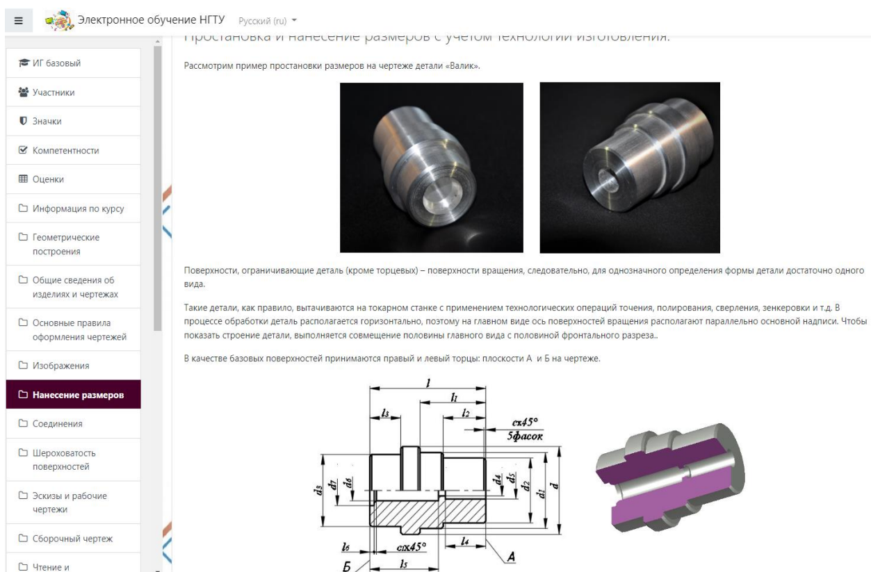
Рис 2. Страница курса «Инженерная графика» по теме «Нанесение размеров»

Раздел «Инженерная графика» содержит аналогичные элементы и ресурсы. Теоретическая часть содержит большое количество рисунков, чертежей, трехмерных моделей, фотографий реальных изделий (рис. 2). Также теоретическая часть содержит ссылки на видеоматериалы процессов изготовления и обработки деталей, взятые из открытых источников в сети Интернет. Раздел содержит справочные данные и ссылки на нормативные документы.